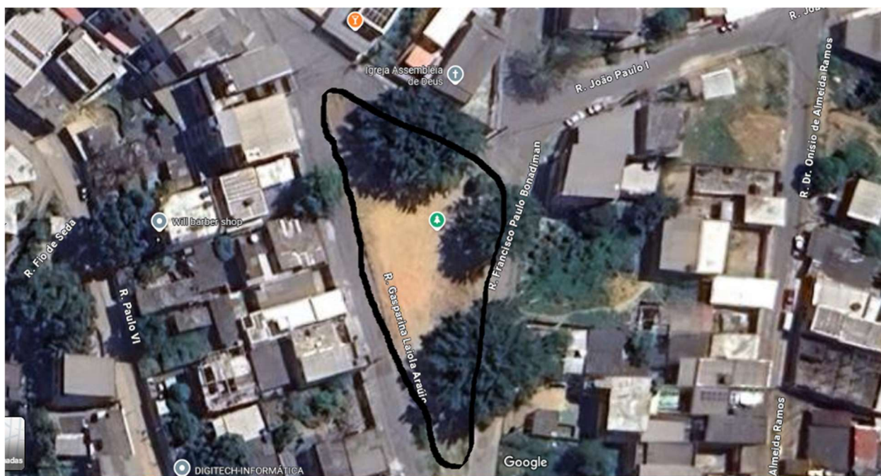
FOTO DO LOCAL A SER CONSTRUÍDA UMA PRAÇA PÚBLICA COM ÁREA DE LAZER COMPLETA (QUADRA DE ESPORTES, PLAYGROUND E ACADEMIA POPULAR) NA ÁREA PÚBLICA (DE FORMATO TRIANGULAR CONHECIDA COMO ÁREA JOÃO PAULO I) BAIRRO SANTA BÁRBARA.