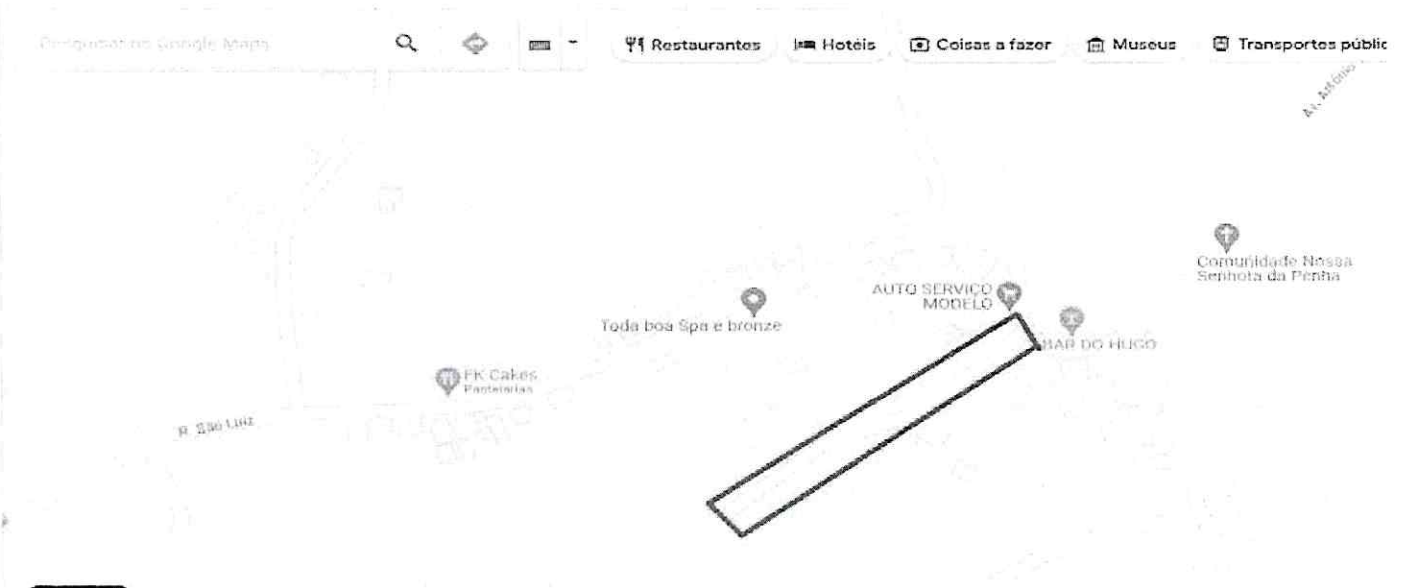
FOTO SATÉLITE DO LOCAL