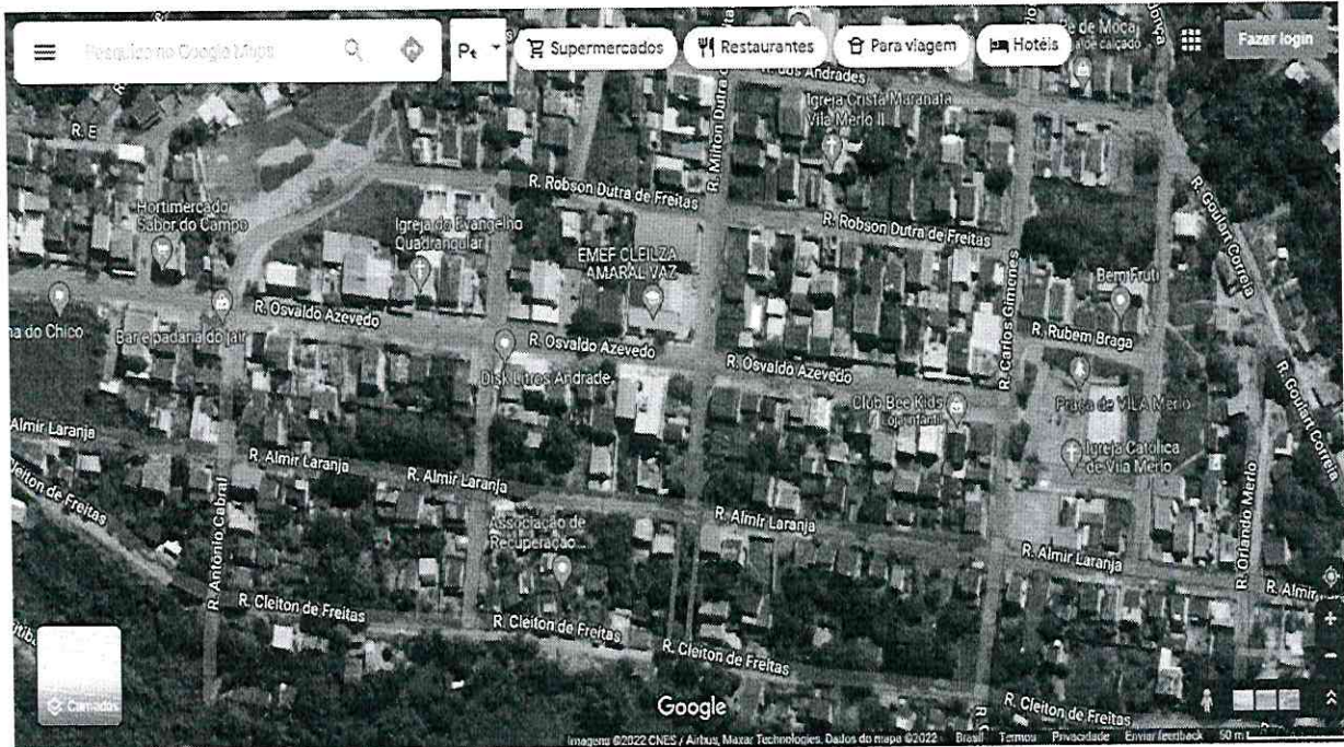
FOTO SATÉLITE DO LOCAL

AUTÓGRAFO Nº 117/2022 PROJETO DE LEI LEGISLATIVO Nº 88 PROCESSO Nº 1339/2022