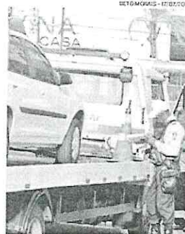
AGENTE de trânsito aplicando multa

As prefeituras afirmam que a lei está sendo cumprida. Na Serra, por exemplo, a administração municipal arrecadou R$ 1.056.906,78 este ano e, de acordo com a prefeitura, parte da verba foi utilizada em sinalização nos locais de maior fluxo, como as avenidas Brasília e