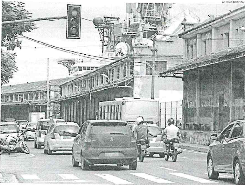
AVANÇO de sinal na avenida Florentino Avidos, em Vitória: semáforos serão trocados e vão contar veículos próximos

No caso de Vitória, a prefeitura informou, em nota, que esse recurso é destinado ao Fundo Municipal de Trânsito, e entre os investimentos está a comunicação digital dos semáforos.